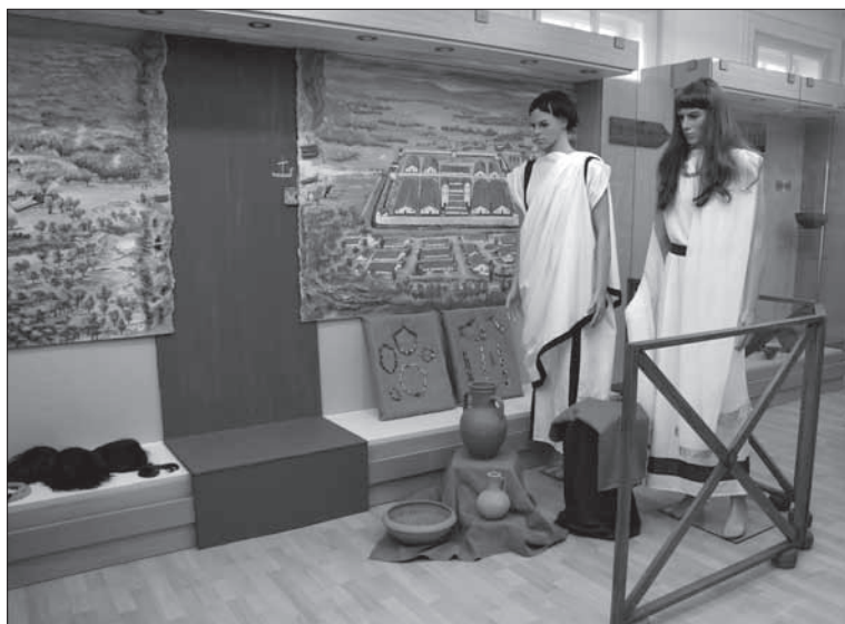
Rekonštrukcia rímskeho mužského a ženského odevu.

Záštitu nad výstavou prevzalo aj Veľvyslanectvo Maďarskej republiky na Slovensku.