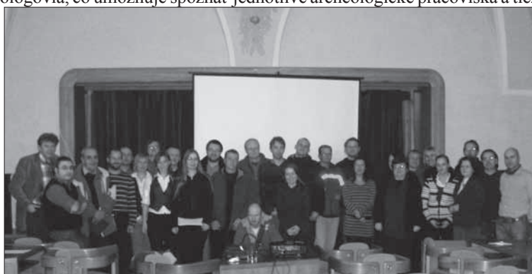
Účastníci stretnutia