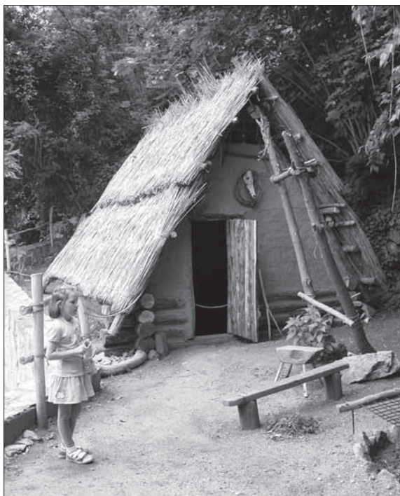
Rekonštrukcia slovanského príbytku v Archeologickom múzeu.

Medzinárodný deň múzeí je už tradične jednou z programových priorít slovenských múzeí. V roku 2011 tento deň pripadol na 14. mája. V SNM – Archeologickom múzeu bolo pre návštevníkov pripravených niekoľko podujatí,