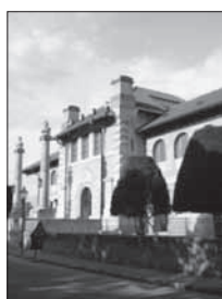
Bad Deutsch Altenburg – Museum Carnuntinum