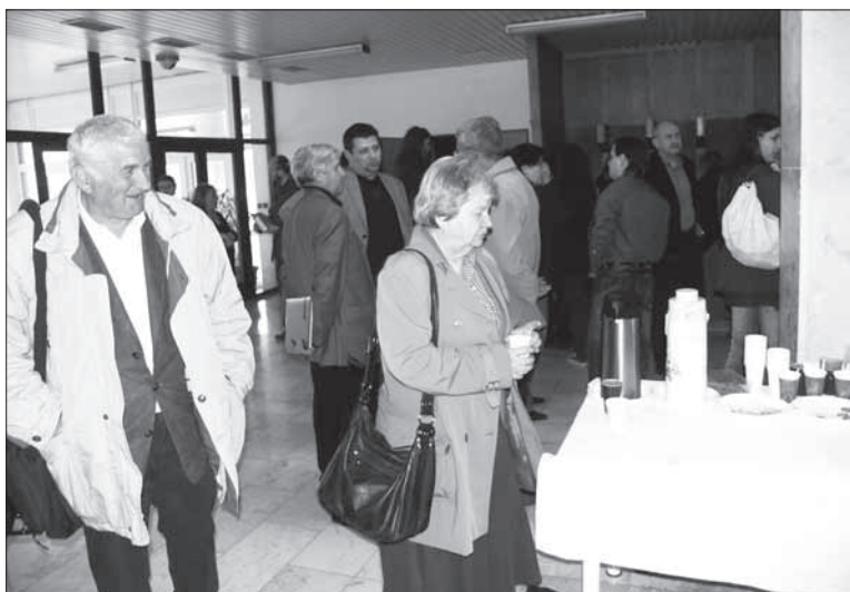
Občerstvenie a neformálna diskusia počas prestávky (foto: E. Čaprďová).

J. Rajtár - R. Ölvecký: Výskum dočasných rímskych táborov z obdobia markomanských vojen