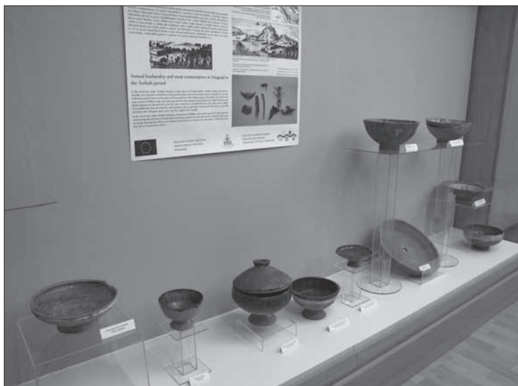
Glazovaná turecká keramika z Vyšehradu, 16 -17. storočie.

V centre pozornosti tejto výstavy však stál „turecký“ Vyšehrad, ktorý počas obdobia osmanskej nadvlády v 16. -17. storočí pobudol v kresťanských rukách len 10 rokov oproti 140 rokom pod tureckým panstvom. Popri načrtnutí dejinných udalostí sa dôraz kládol predovšetkým na priblíženie každodenného života doby. Výstava bola peknou ukážkou spojenia a zosúladenia výsledkov historickej vedy a archeologického bádania. Vďaka rôznorodosti vystavených archeologických nálezov si návštevníci mohli vytvoriť obraz nielen o zbraniach a nástrojoch používaných predovšetkým vojenskou zložkou, ale aj o celkom bežných predmetoch dennej potreby, ako sú nádoby na pečenie a varenie, krásne misky na nôžke, viacfarebná glazovaná