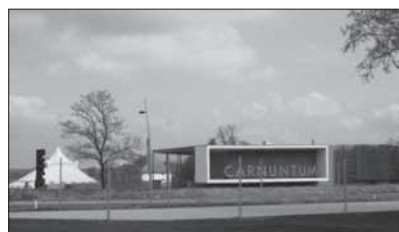
Informačné centrum Petronell Carnuntum