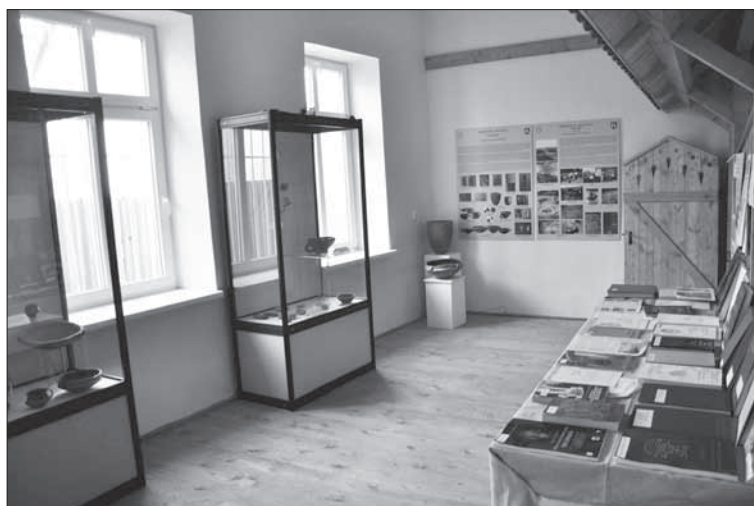
Pohľad na časť expozície so sídliskovými nálezmi.