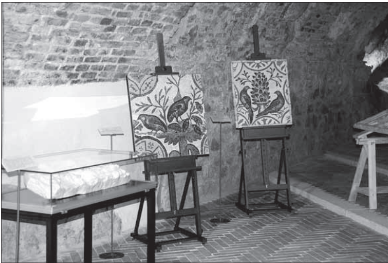
Výstava „Aquileia križovatka Rímskej ríše. Záber na mozaiky.

vývoj tohto pre stredodunajskú oblasť významného mesta, obchodného a kultúrneho strediska od jeho založenia v 2. stor. pred n. l. po včasnokresťanské obdobie. Texty sú v angličtine s čiastočným slovenským prekladom. Zdokumentovaný je nielen urbanistický a architektonický vývoj mesta, ale aj umelecké remeslá (významné bolo sklárstvo), kultová sféra a pod. Súčasťou výstavy je aj výber kvalitných replík z kamenosochárskych diel (portrétno umenie, reliéfy) a unikátne včasnostredoveké mozaiky. Výstava potrvá do 14. septembra 2011 a predpokladá sa jej prenesenie do Košíc.