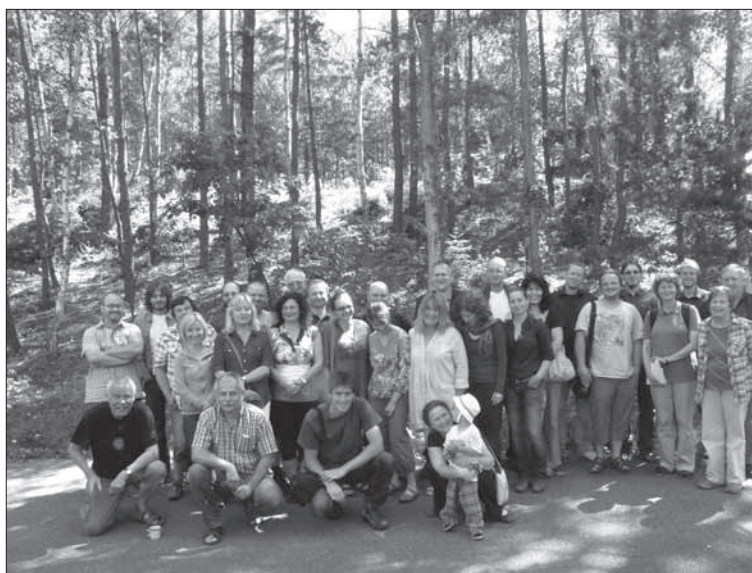
Účastníci konferencie.