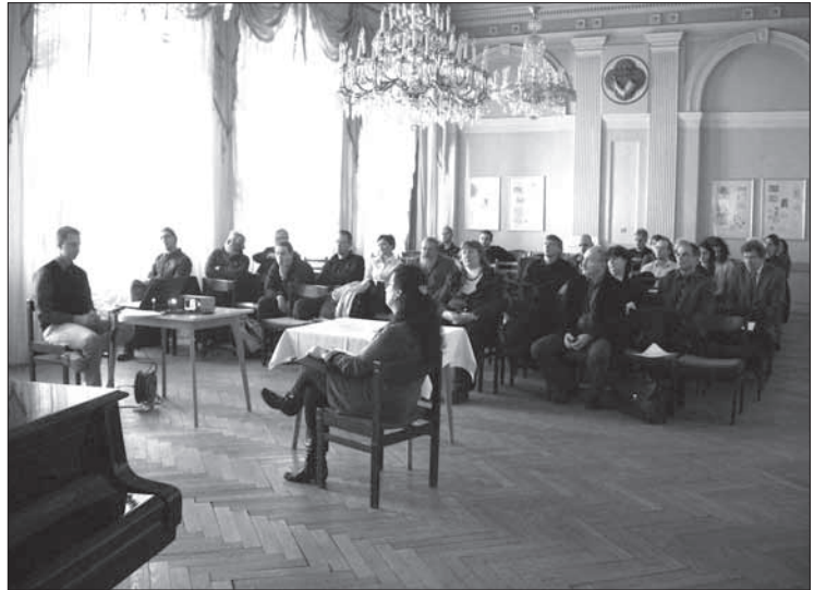
Pohľad na účastníkov 3. diskusného fóra.