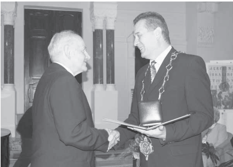
pri preberaní významného ocenenia z rúk primátora Nitry