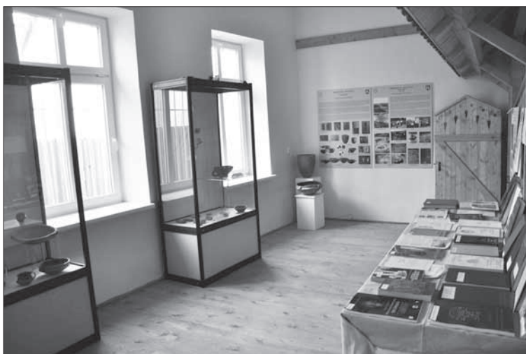
Pohľad na časť expozície so sídliskovými nálezmi.