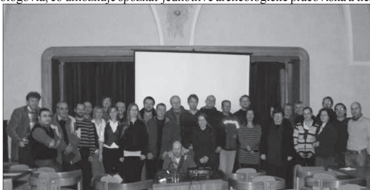
Účastníci stretnutia