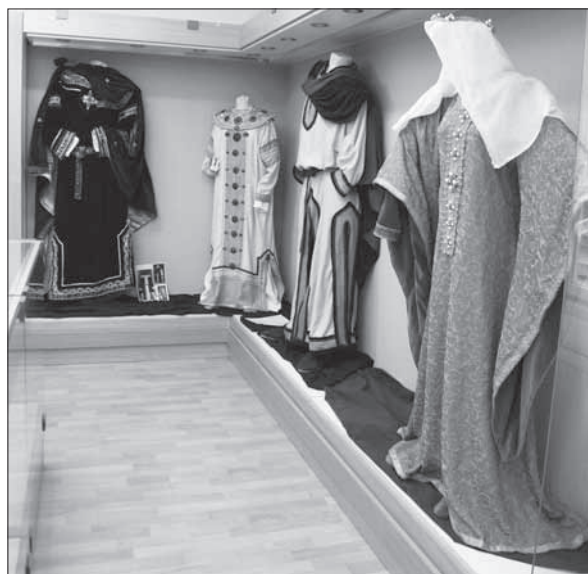
Ukážka byzantského ranostredovekého odievania.

Skupina hlinených, výnimočne i kamenných predmetov sa v malebnej talianskej reči nazýva ako „Tavolette enigmatici - Tajuplné tabuľky“. Ich slovenské pomenovanie „Bochníkovité idoly“ vychádza z najčastejšie sa vyskytujúceho tvaru pripomínajúceho zmenšený model bochníku chleba. V terminológii korektní, ale popisní Nemci im niekedy hovoria „Ornamentom pokryté hlinené objekty“. Tieto 5-10cm dlhé predmety pokrývajú totiž skupinky odtlačkov i vyrytých obrazcov kombinovaných do skupín a rôznych zoskupení. Usporiadanie rýh a odtlačkov nie je výsledkom náhody, ale vopred premysleného zámeru. Podľa rôznych interpretácií sa uvažuje, že ide o počítačový systém, možno dokonca o istý druh ranného znakového písma. Ďalšie ich označujú ako pečate, napríklad pre