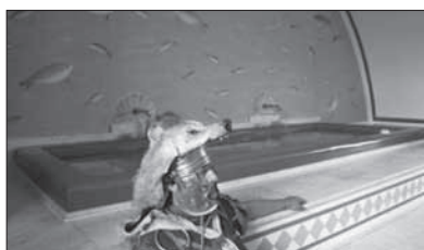
Rímsky legionár v kúpeľoch